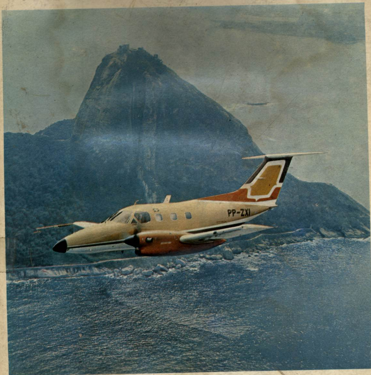
EMB 121 — XINGU O MAIS RECENTE PRODUTO DA TECNOLOGIA AERONÁUTICA BRASILEIRA